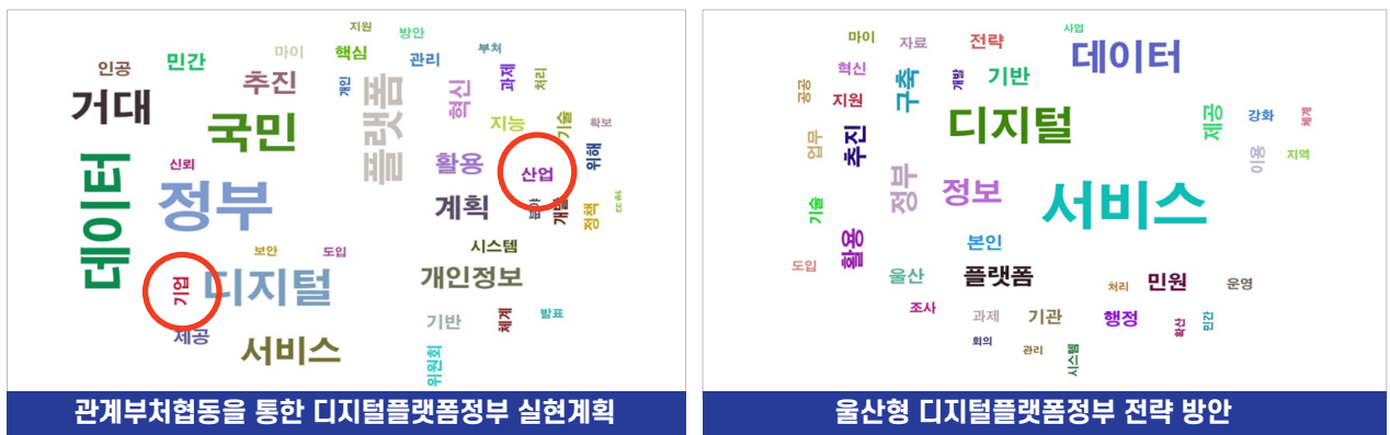
그림2 정부와 울산간 키워드 분석

- 정부와 울산 간 전략 보고서를 상호 키워드 분석한 결과, 정부전략 대비 울산은 ‘기업’, ‘산업’ 등 키워드 빈도가 적은 것으로 나타나 보완책 마련 필요